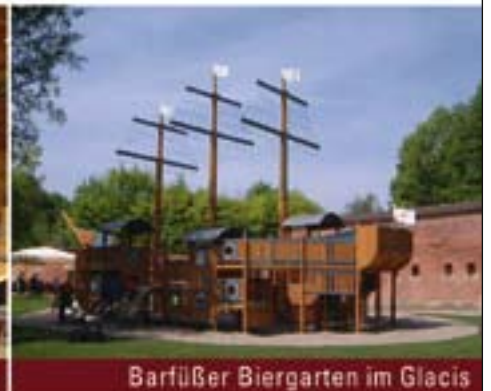
Barfüßer Biergarten im Glacis