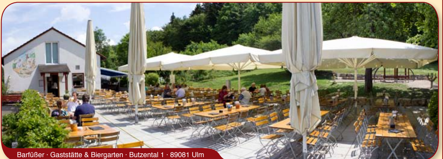
Barfüßer · Gaststätte & Biergarten · Butzental 1 · 89081 Ulm

Sie finden uns 2 x in Neu-Ulm sowie im Butzental und in Ulm.