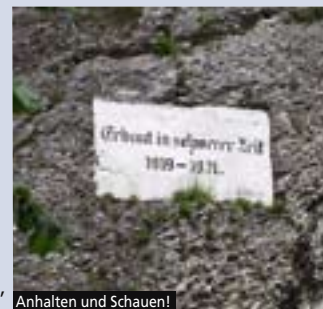
Anhalten und Schauen!

Diese Tour führt uns zuerst über die Schwäbische Alb von Ulm Richtung Geislingen. Auf schönen kurvigen Nebenstraßen über Westerstetten fahren wir direkt zu der Burgruine Helfenstein. Von dort gibt es einen wunderschönen Blick in das Filstal und auf Geislingen hinab. Auf der Serpentinstraße hinunter nach Geislingen lesen wir ein Schild: Erbaut in schwerer Zeit 1919 – 1920. Nach dem 1. Weltkrieg mit viel Hunger im Bauch. Von Geislingen führt uns die Tour durch das kleine Eybachtal an der Roggenmühle vorbei zum gut erhaltenen Schloß Weißenstein, welches sich idyllisch an den dicht bewaldeten Bergrücken schmiegt. Von dort beginnt die Tour sich auf die herrliche Ostalb mit ihren typischen Hügeln über die kurvige Straße der Stauer zu bewegen. Über diese Ostalb kommen wir in einem weiten Bogen zu der ganz Heidenheim dominierenden Burg Hellenstein. Von dort geht die Reise auf