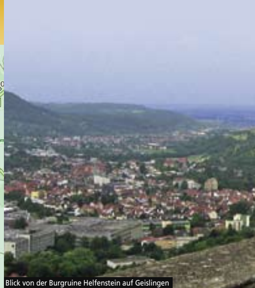
Blick von der Burgruine Helfenstein auf Geislingen