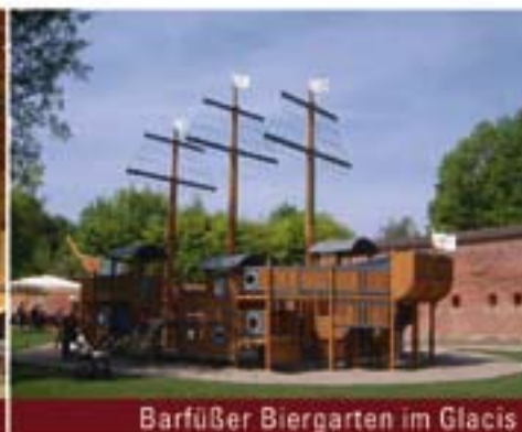
Barfüßer Biergarten im Glacis