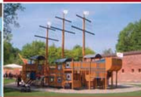
Barfüßer Biergarten im Glacis