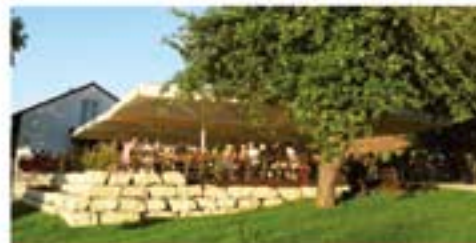
Barfüßer Gaststätte im Butzental