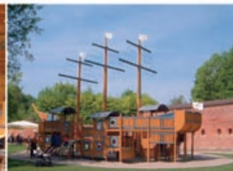
Barfüßer Biergarten im Glacis