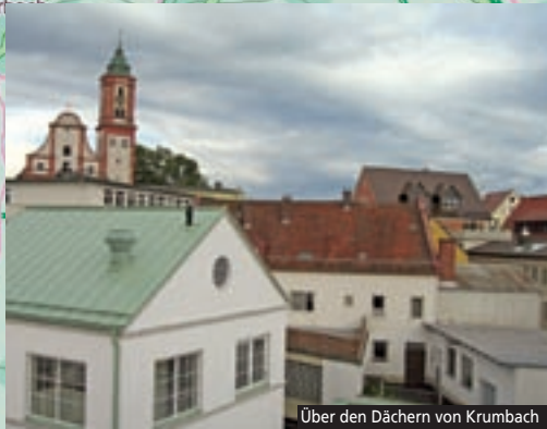
Über den Dächern von Krumbach