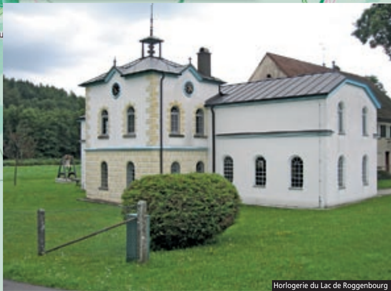
Horlogerie du Lac de Roggenbourg