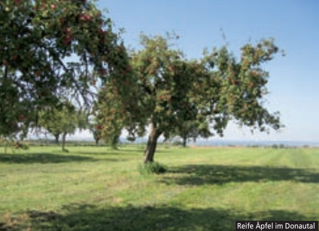
Reife Äpfel im Donautal